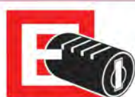
Disponibile anche con nottolino estraibile